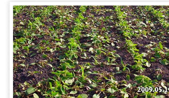
Szójaállomány posztemergens kezelés előtt és után, Újmohács