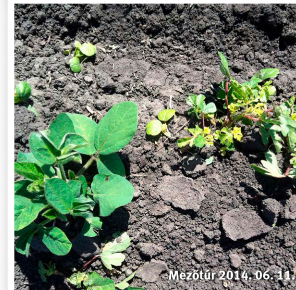
Refine® 15 g/ha 10 nappal kezelés után