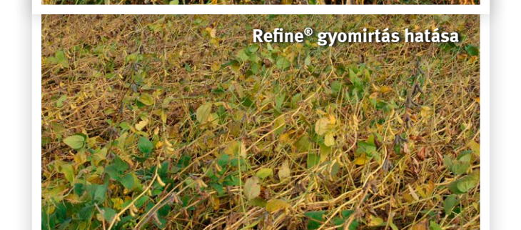
Kezelési hiba és tiszta állomány, Bóly, Töttös Zrt., 2010